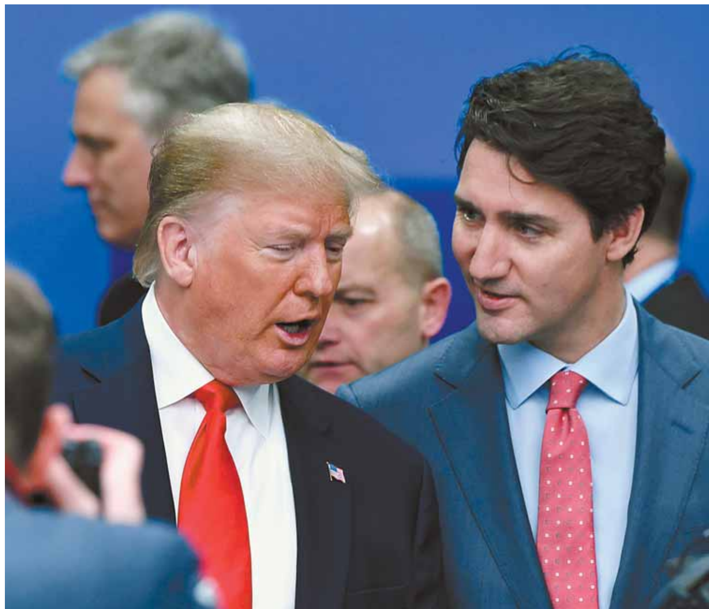
Mercredi, Justin Trudeau s'est approché de Donald Trump, apparemment pour s'expliquer sur la vidéo de la veille, mais le président des États-Unis n'a pas paru souhaiter prolonger l'échange avec le premier ministre canadien.