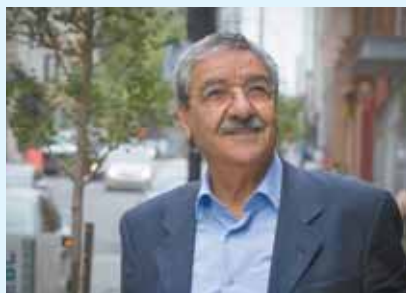
Saïd Sadi