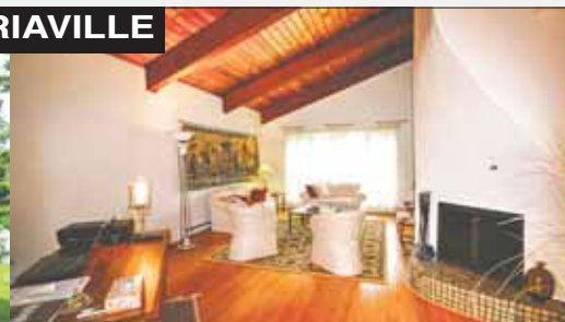
449 000 $