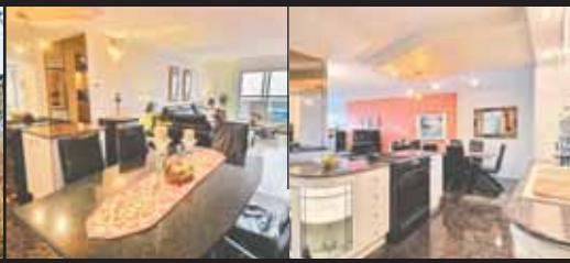
FACE AU PARC LAFONTAINE, PRÈS MÉTROS ET SERVICES