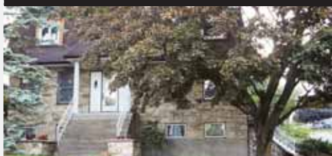
VISITE LIBRE DIM. 8 ET 29 OCT. 13H À 17H