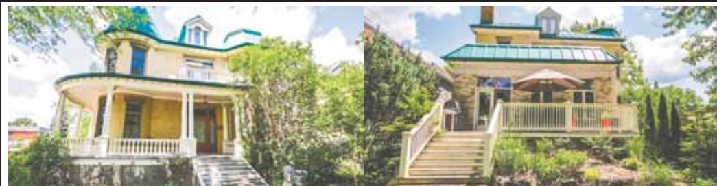
1 boul. Guoin Est coin St-Laurent

Véritable joyau patrimonial, maison construite en 1912, et entretenue par des propriétaires consciencieux. 5 chambres à coucher ou plus, bibliothèque, bureau, salle familial avec foyer au gaz, cuisine rénovée en 2015, 3 salles de bains, une salle d'eau, 2 terrasses, cour arrière. 5 minutes à pied de la station de métro Henri-Bourassa. 1 649 000 $ - CENTRIS # 19830691