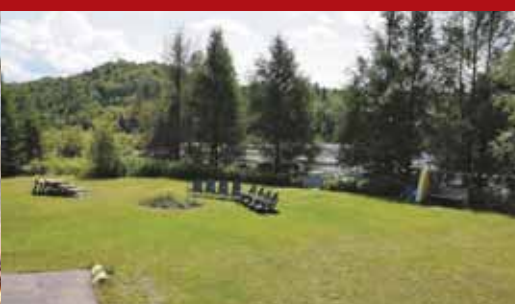
9415, ROUTE 125

Maison Clé en Main avec une grande fenestration, pour admirer la vue panoramique. Situé à 1h de Montréal, près des pistes de VTT, motoneige ainsi que plusieurs terrains de golf, stations de ski. Un beau petit coin de paradis! 269 000$ - CENTRIS # 9567567