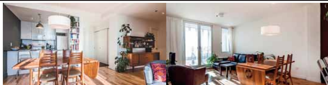
701 rue Irène #316

PRÈS DU MARCHÉ ATWATER - Appartement lumineux. 3 e étage de 2 chambres à coucher + GARAGE. Espace de rangement sur le même étage. Balcon privé + terrasse commune sur le toit & piscine dans la cour. Espace commun intérieur à réserver pour les fêtes. Près de 2 stations de métro. 425 000 $ - CENTRIS # 16022349